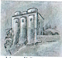
chiesa di San Marco (metà dell'XI secolo)

ISTITUTO COMPRENSIVO A.AMARELLI VIA GRAN SASSO n. 16 - 87067 ROSSANO - TEL.0983/512197 - FAX 0983/291007